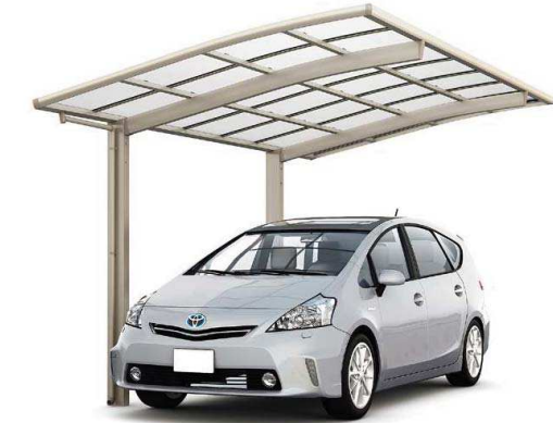
シャイングレー 27-50型 屋根材色クリアマット

本製品は、隣地境界を目的に設置するもので、防護柵や手すりの機能はありません。設置場所と機能に合った製品をお選びください。